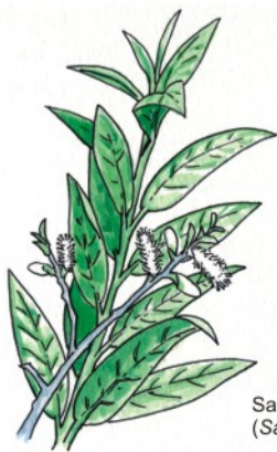
Sauce canario ( Salix canariensis )

Si se fija, descubrirá cómo forman un bosque llamado saucedada, a lo largo del cauce hasta El Pelotón.