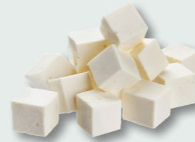
Queso de cabra

¿Ya has probado todos estos productos locales de Anaga? Have you tried all of these local products from Anaga?