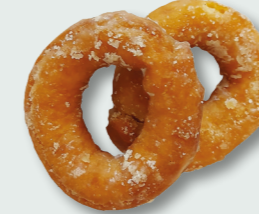
Rosquetes de batata